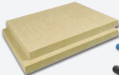
Knauf Insulation TERMOTOP® plošče za zunanjo izolacijo poševnih streh